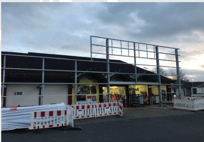
SAGASSER Getränkefachmarkt in Bad Neustadt vor und nach der Installation der unverwechselbaren SAGASSER-Fassade